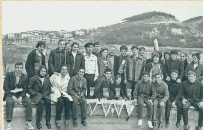
Ученици със спортни отличия, ок. 1972 г. ДА – Смолян, ф. 283, оп. 5, а.е. 15, л. 25 гр

Към училището има добре обзаведен ученически пансион, полудневна детска градина и занимални.