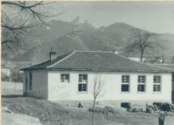
Училищната сграда построена през 1936г.

През 1936/1937 г. учебните занятия започват да се водят в новопостроената училищна сграда с две класни стаи в района на поделението .